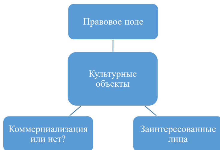
Рис. 2. Коммуникационные связи культурного объекта в вузе

Особенности деловой коммуникации при управлении культурными объектами в вузе. Управление культурными объектами в вузовской среде сопряжено с рядом коммуникационных вызовов, которые можно сгруппировать в три блока (рис. 1).